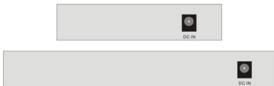
Рис 2. Задняя панель

На задней панели расположен стандартный разъем для подключения к источнику питания.